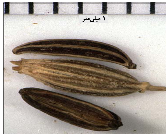
شکل ۱- میوه کامل گیاه زیره سبز (در وسط) به همراه دو عدد مریکارپ دیگر در طرفین

اواخر اردیبهشت تا اواخر خرداد ماه، بسته به شرایط آب و هوایی برداشت می‌شود. جهت جلوگیری از ریزش دانه، و زمانی که بوته به زردی می‌گراید، محصول را با دست یا داس برداشت می‌کنند و پس از خشک‌شدن کامل بوته، خرمن را با چوب دست یا حرکت دادن چهارپایان و تراکتورهای کوچک می‌کوبند. محصول را با استفاده از غربال‌های دستی و باد دادن تمیز می‌کنند (Kafi et al. , 2002). این روش برداشت نیاز به صرف وقت و نیروی کار زیاد دارد و ضمن آن بخشی از محصول نیز به دلیل کوبیدن ناقص، کاهش کیفیت به لحاظ وجود